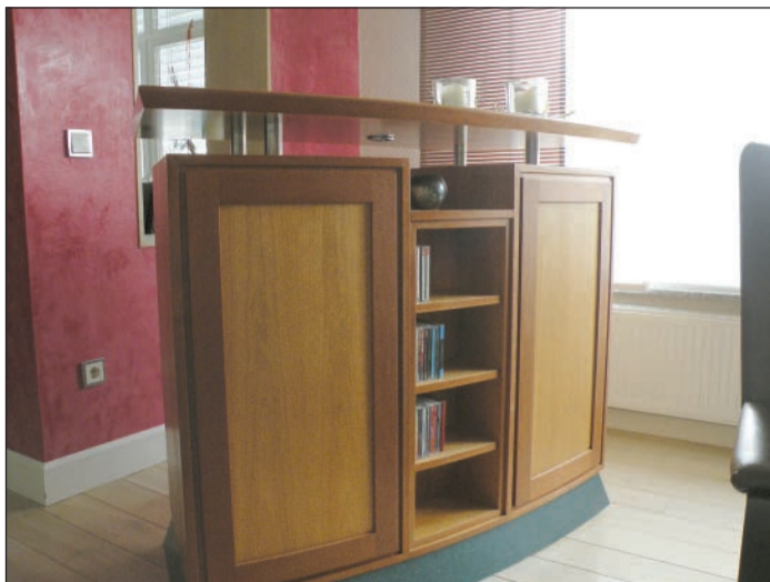
Schmuckstück: Diese Theke bietet mehr als nur Funktion.