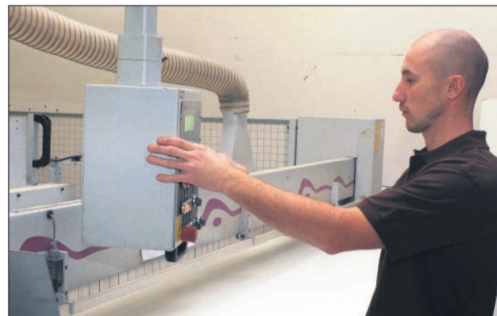
Teil des modernen Maschinenparks in der Tischlerei Fangmann ist die Plattenaufteilsäge für exaktes Sägen.